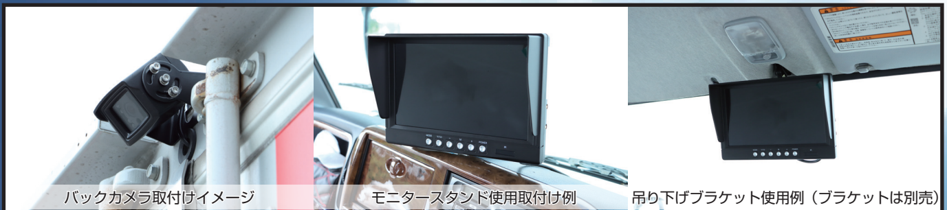
バックカメラ取付けイメージ